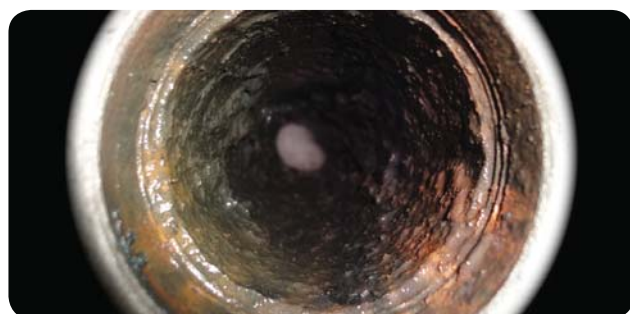
10 mois après l'installation du système Aqua-4D®