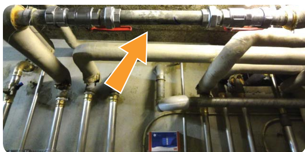
Tube de contrôle pour vérifier l'efficacité du traitement Aqua-4D®