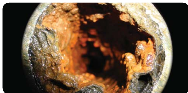
Avant l'installation du système Aqua-4D®