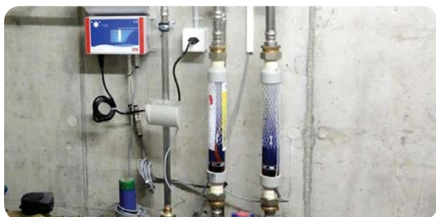
Installation Aqua-4D® sur l'arrivée d'eau d'un bâtiment